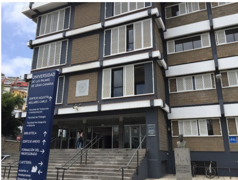
Edificio de Humanidades 1

En él se encuentran, entre otras infraestructuras (como el Salón de Actos, la Sala de Juntas o la Administración, junto a las Delegaciones de Alumnos, las salas de estudio