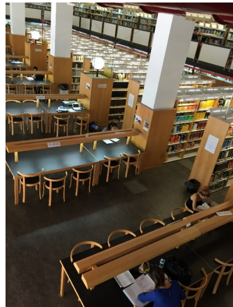
Interior de la Biblioteca de Humanidades

La Biblioteca de Humanidades, situada entre el edificio principal y el anexo, cuenta entre sus recursos con 126 puestos de lectura para la consulta de sus fondos, que alcanzan los 126.700 ejemplares (entre monografías, publicaciones periódicas, obras de referencia, tesis, mapas, separatas, normas, microformas, diapositivas, material audiovisual y material multimedia), 50 ordenadores portátiles y 7 lectores de libros electrónicos susceptibles de préstamo, 2 fotocopiadoras de autoservicio y 2 escáneres.