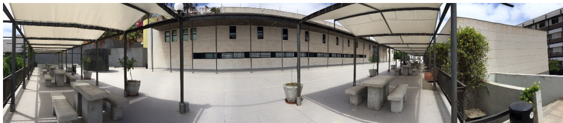
Panorámica del edificio anexo de Humanidades

En este edificio se encuentran diferentes laboratorios, talleres y seminarios que se utilizan, principalmente, para las clases prácticas.