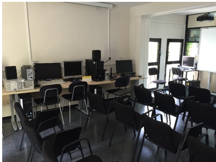
Laboratorio de Fonética

Así, el Laboratorio de Fonética es el aula de prácticas de la asignatura de Fonética del español , que se imparte en el Grado en Lengua Española y Literaturas Hispánicas; el Laboratorio de Idiomas se utiliza para algunas de las prácticas de las asignaturas de Tercera lengua y su cultura I y II , del Grado en Lenguas Modernas; y al Taller de Creación y Artes Escénicas “Josefina de la Torre” acuden los alumnos del grupo de teatro para ensayar sus actuaciones, que luego representan en la Sala de Grados, alojada en el mismo edificio. Esta sala se utiliza también para la defensa de las tesis doctorales o para celebrar diferentes encuentros de investigación o seminarios y conferencias.