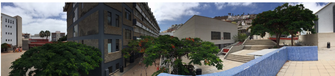
Panorámica del edificio de Humanidades, la Biblioteca y el edificio anexo

Por último, el campus del Obelisco dispone de una cafetería, otro punto de encuentro entre alumnos, profesores y PAS, que ofrece dos espacios, uno interior y otro exterior, en los que poder recargar fuerzas para continuar con las tareas exigidas de cara al correcto desarrollo de las distintas enseñanzas de las titulaciones.