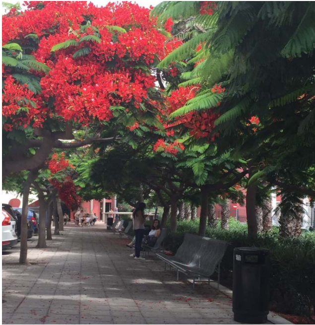
Paseo de los flamboyanes, con la cafetería al fondo

Por último, el campus del Obelisco dispone de una cafetería, otro punto de encuentro entre alumnos, profesores y PAS, que ofrece dos espacios, uno interior y otro exterior, en los que poder recargar fuerzas para continuar con las tareas exigidas de cara al correcto desarrollo de las distintas enseñanzas de las titulaciones.