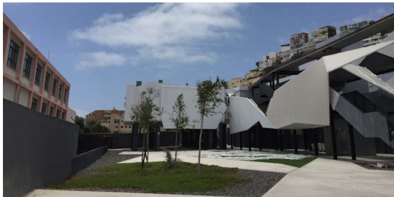
Aulario del Obelisco

Se trata del segundo gran espacio destinado a la docencia que, al igual que el edificio principal, es compartido por las distintas facultades. En un principio, era un centro de educación secundaria, rehabilitado en 2014 por la ULPGC para resolver los problemas de falta de aulas del campus del Obelisco. En él hay tres módulos, dos de los cuales (módulo A y módulo B; en el primero también está alojada la estructura de Teleformación y el Instituto Universitario de Análisis y Aplicaciones Textuales, IATEX) se dedican a la docencia, con aulas que cuentan con diferente capacidad y equipamiento; de entre ellas, tres están asignadas solo a la Facultad de Filología (la A13, la B04 y la B15), mientras que hay otras cuatro que comparte con las facultades de Traducción e Interpretación y de Geografía e Historia: