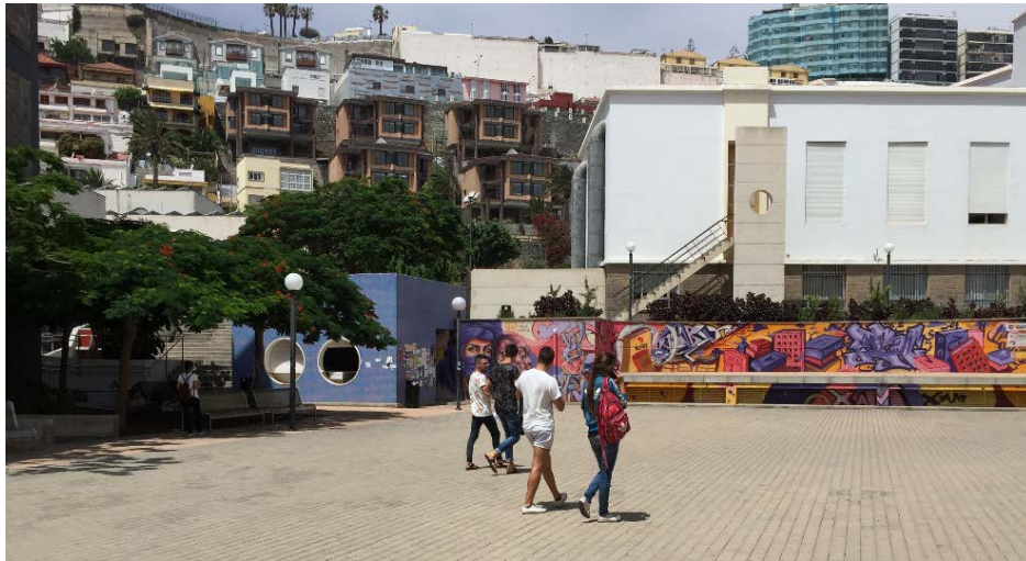
Patio central de Humanidades

Este patio, que comparten las cuatro facultades del campus del Obelisco, es el lugar de celebración de muy diversas actividades lúdicas y festivas (celebración del Día del Libro, del Día de Canarias, exposición de las artes marciales milenarias de Shaolin, promovida por el Instituto Confucio, etc.) que congregan a los distintos miembros de la comunidad universitaria (profesores, PAS, alumnos), además de que cuenta con un escenario en el que se desarrollan las presentaciones de los diferentes actos o las actuaciones programadas.