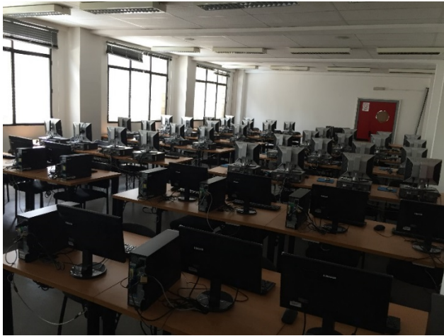
Aula de Informática

Literaturas Hispánicas). A su vez, el Aula de Audiovisuales está destinada a muchas de las asignaturas del Máster en Cultura Audiovisual y Literaria.