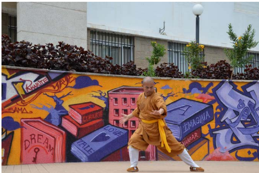
Actuación en el escenario del patio de Humanidades

Este patio, que comparten las cuatro facultades del campus del Obelisco, es el lugar de celebración de muy diversas actividades lúdicas y festivas (celebración del Día del Libro, del Día de Canarias, exposición de las artes marciales milenarias de Shaolin, promovida por el Instituto Confucio, etc.) que congregan a los distintos miembros de la comunidad universitaria (profesores, PAS, alumnos), además de que cuenta con un escenario en el que se desarrollan las presentaciones de los diferentes actos o las actuaciones programadas.